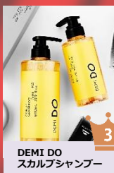
DEMI DO スカルプシャンプー