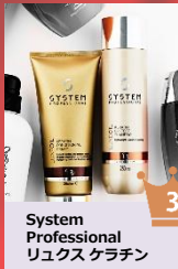
System Professional リュクス クラチン