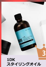
1DK スタイルングオイル