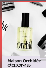
Maison Orchidée グロスオイル